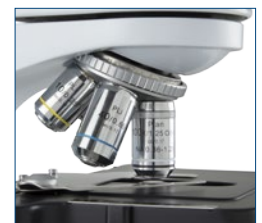
● S100x oil objective with built-in iris diaphragm

*** Objetivo de inmersión en aceite Súper Contraste PLiS100x corregido con infinito (IOS) con diafragma iris incorporado Todas las ópticas están recubiertas con tratamiento anti-fúngico y anti-reflectante para un rendimiento máximo de la luz